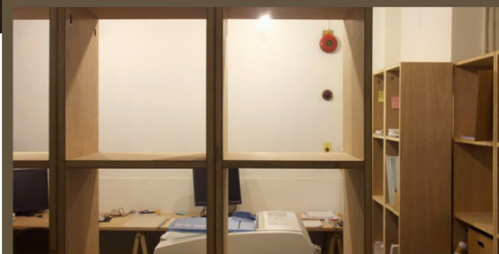
メンバー (2012/12/10 現在)

その他質問がございます方は knot@groundscape.jp までご連絡下さい。