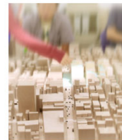
(上) GS デザイン Workshop 2012 より

GROUNDSCAPE knot は NPO 法人 GS デザイン会議が提供するシェアワーキング/イベントスペースです。GS デザイン会議とは 2005 年に任意団体として発足した分野協働型のネットワーク ( http://www.groundscape.jp/ ) です。knot は同組織の理念のもと、分野を越えた活動を行うデザイナー、エンジニアを積極的に支援しその「knot=結び目」となることを目的としています。